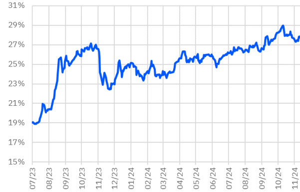
TRT130733T17 Faiz Getirisi (10Y Sabit Kuponlu)