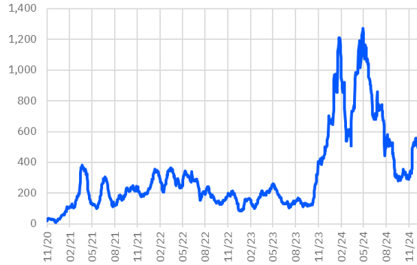
TRT011025T16 Aylık Ort. İşlem Hacmi - mln