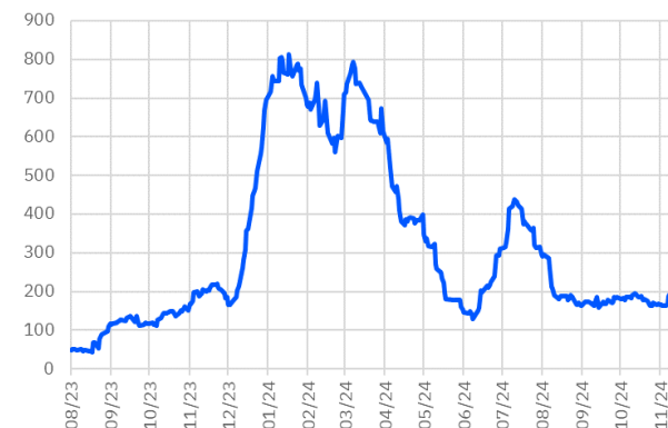
TRT130733T17 Aylık Ort. İşlem Hacmi - mln