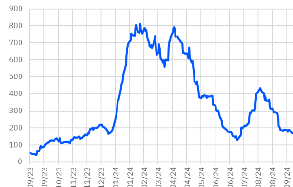
TRT130733T17 Aylık Ort. İşlem Hacmi - mln