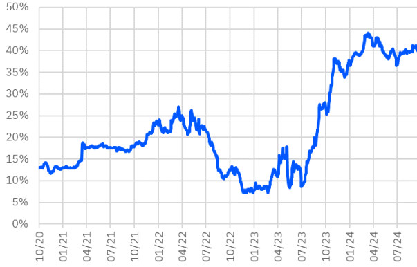
TRT011025T16 Faiz Getirisi (2Y Sabit Kuponlu)