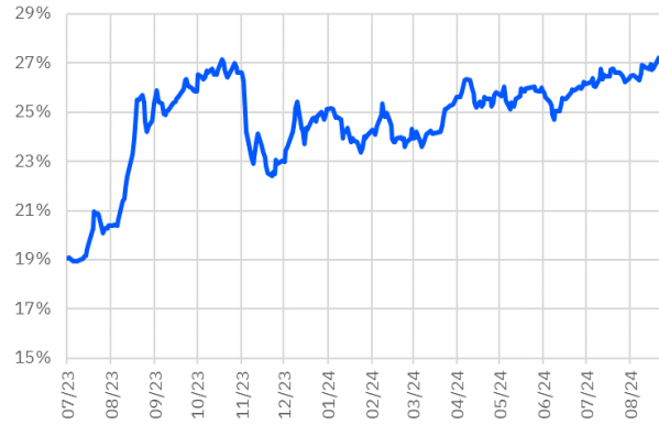
TRT130733T17 Faiz Getirisi (10Y Sabit Kuponlu)