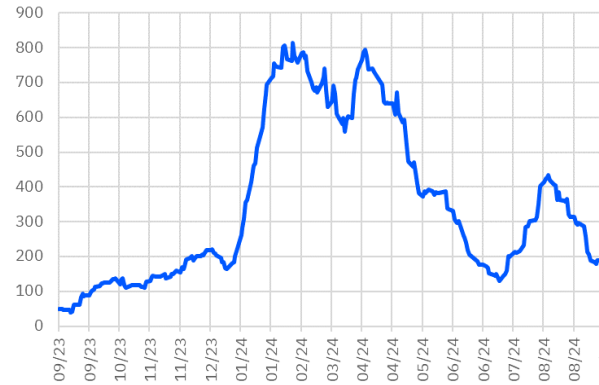
TRT130733T17 Aylık Ort. İşlem Hacmi - mln